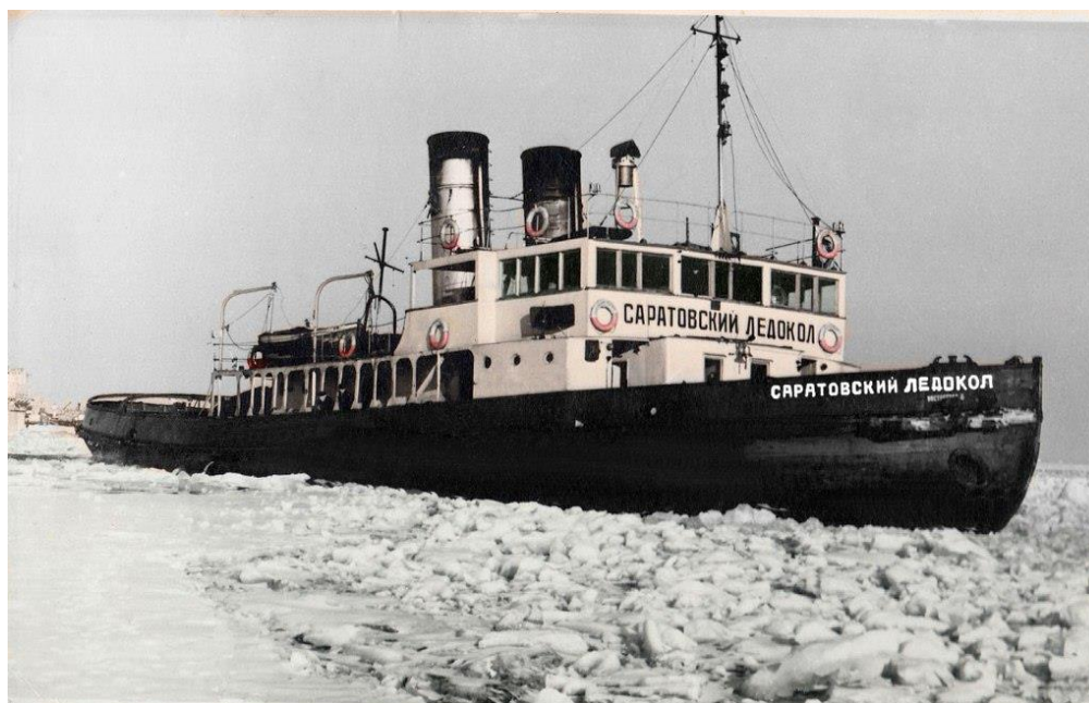
Рис. 1 – Саратовский ледокол производства компании Sir W.G. Armstrong Mitchell & Co (Великобритания, Ньюкасл) (адапт. из [3])

В конце XIX века (а точнее, в 1895 году) английской компанией Sir W.G. Armstrong Mitchell & Co по заказу российского Общества Рязанско-Уральской железной дороги был построен Саратовский ледокол – он изображен перед вами на рисунке (рис. 1).